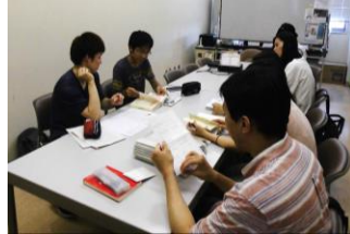
〈研究室でディスカッション中〉 ※これはR1年度の様子です。R2～3年度はオンラインでゼミを実施しました。