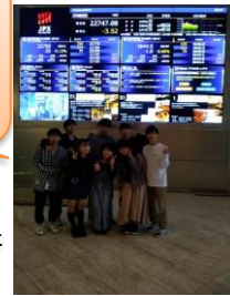
〈大阪取引所訪問〉 ※これはR1年度に訪問した際の写真です。

R2年度は公務員志望の3年生が中心になり、NRI学生小論文コンテストに参加しました。