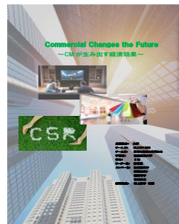
〈3年生が執筆したレポート〉